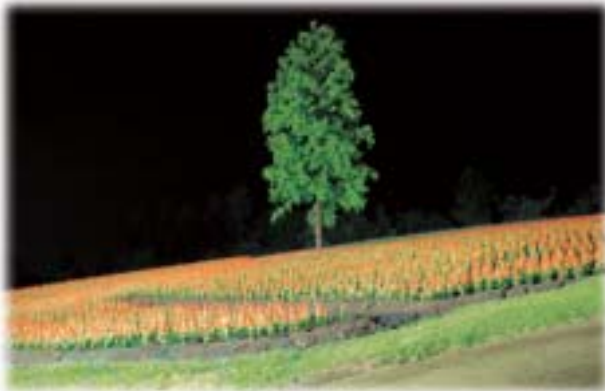
光の丘一面に咲く鮮やかなサルビア

初秋のとっとり花回廊ムーンライト・フラワーガーデンへ行ってきました。月明かりをイメージした優しい光が園内を美しく照らし出し、昼間とはひと味違った