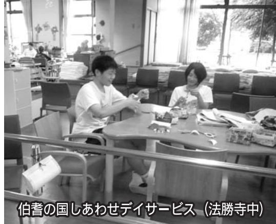
伯耆の国しあわせデイサービス (法勝寺中)