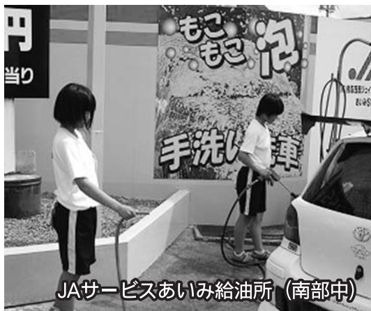
JAサービスあいみ給油所 (南部中)