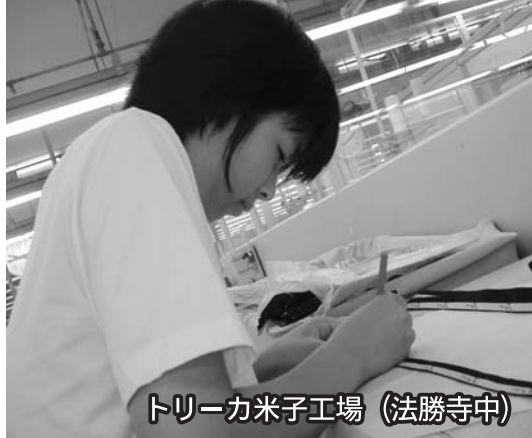
トリーカ米子工場 (法勝寺中)