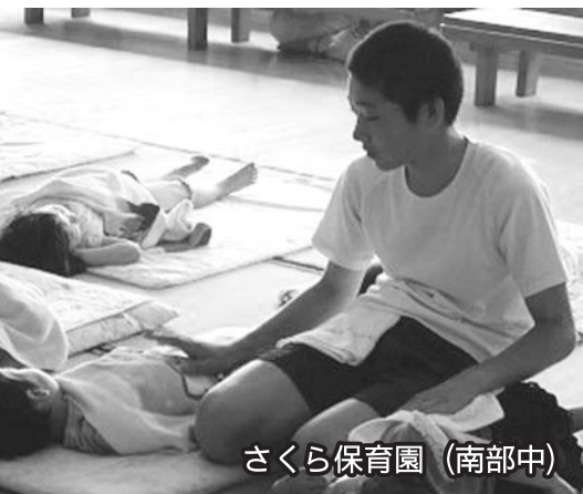
さくら保育園 (南部中)