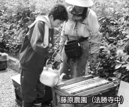
藤原農園 (法勝寺中)