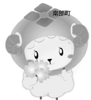
南部町自殺予防キャラクター スーミン