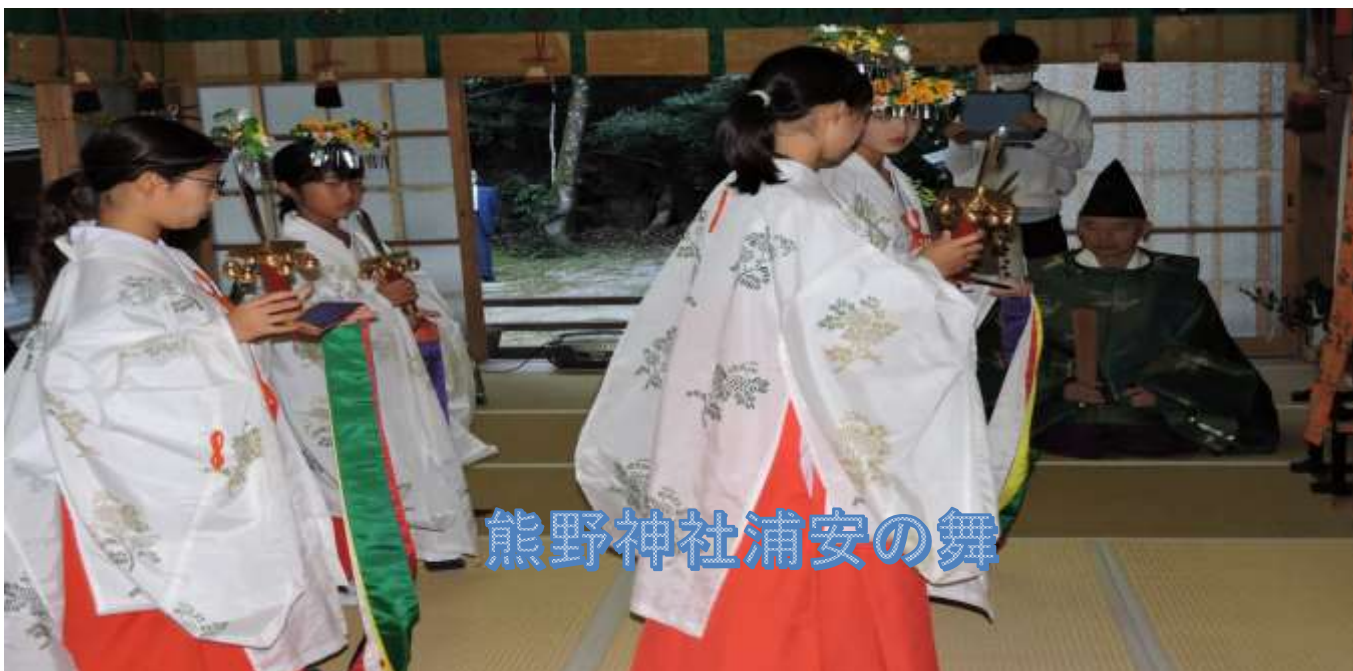
熊野神社浦安の舞