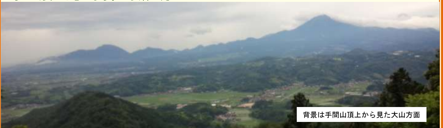
背景は手間山頂上から見た大山方面