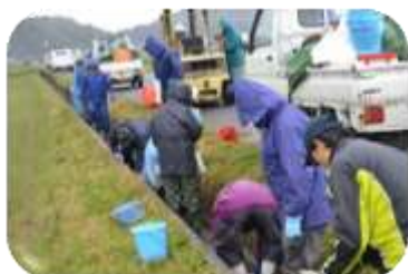
<用水路の目地補修>

農地水環境保全会では、春に用水路の目地補修を行いました。また、区民農園ではサツマイモの苗植えと、8月にジャガイモの種芋植えを行いました。